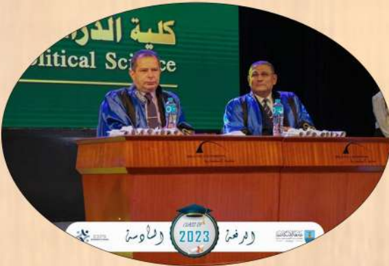
كلية الدراسات الاقتصادية والعلوم السياسية