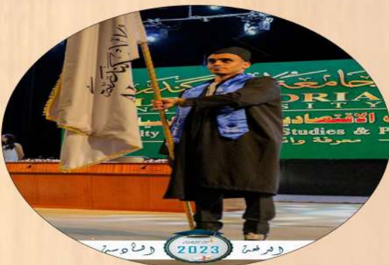
كلية الدراسات الاقتصادية والعلوم السياسية