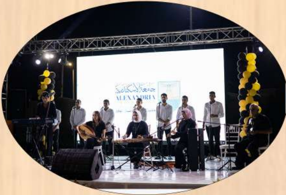
كلية التربية النوعية