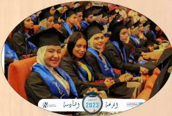
كلية الدراسات الاقتصادية والعلوم السياسية