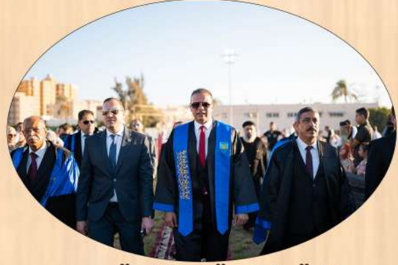
كلية التربية الرياضية بنين