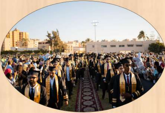
كلية التربية الرياضية بنين