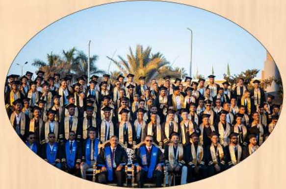
كلية التربية الرياضية بنين