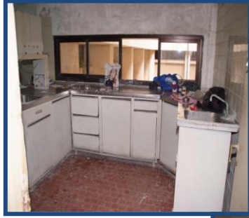
معمل فنين الاستعاضة الصناعية