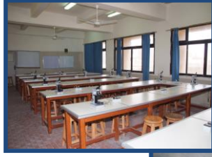
مدرج بيولوجيا و باثولوجيا الفم