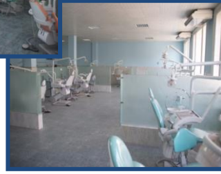
عيادة الاطفال 1