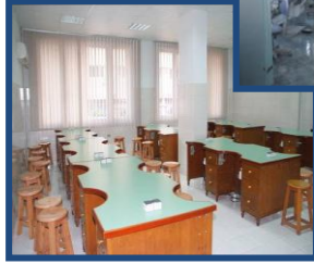
معمل تدريب اسنان الاطفال