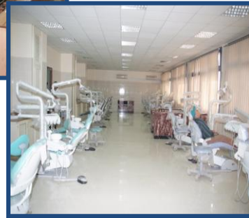
عيادة طب الفم