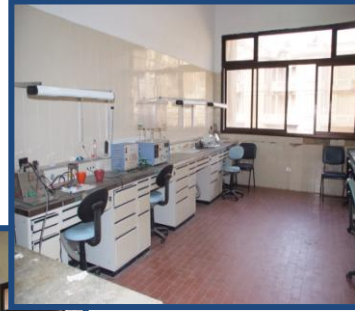
معمل فنين العلاج التحفظي