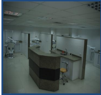
عيادة جراحة الفم والوجه والفكين (الدراسات العليا)